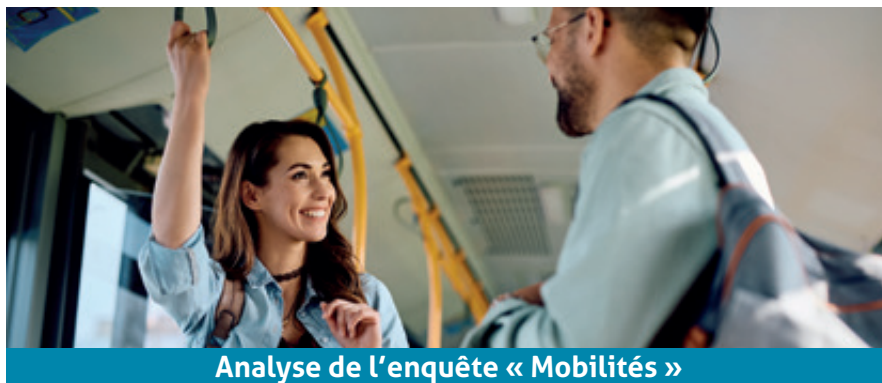
Analyse de l'enquête « Mobilités »