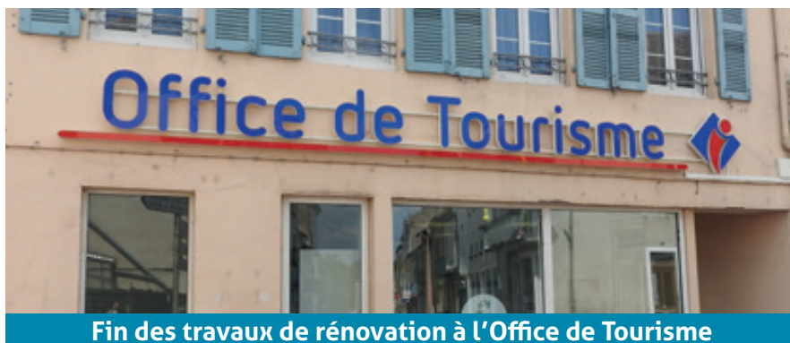
Fin des travaux de rénovation à l'Office de Tourisme