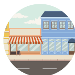
VOIES DE CENTRE BOURG les voies à l'intérieur des panneaux de signalisation des communes