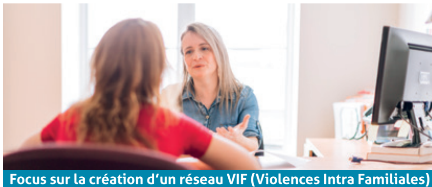
Focus sur la création d'un réseau VIF (Violences Intra Familiales)